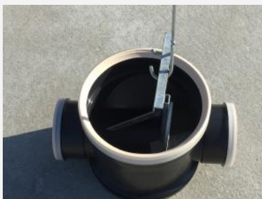
Relevage de l'obturateur et sortie du tabouret