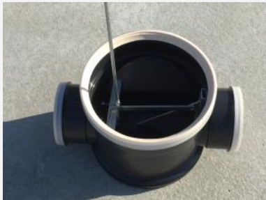
Saisie par la griffe