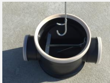
Retrait de la griffe