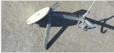
Tenue avec griffe