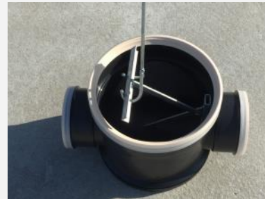
Relevage de la petite équerre